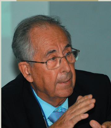
Embajador Tomás Lozano Escribano

Su vocación iberoamericana se despertó en él desde muy joven. América Latina, su historia, su cultura, su literatura... sus gentes. Como no podía ser de otra forma, el amor temprano por las tierras americanas le llevó a sentir una profunda sensibilidad hacia los Pueblos Indígenas de Iberoamérica.